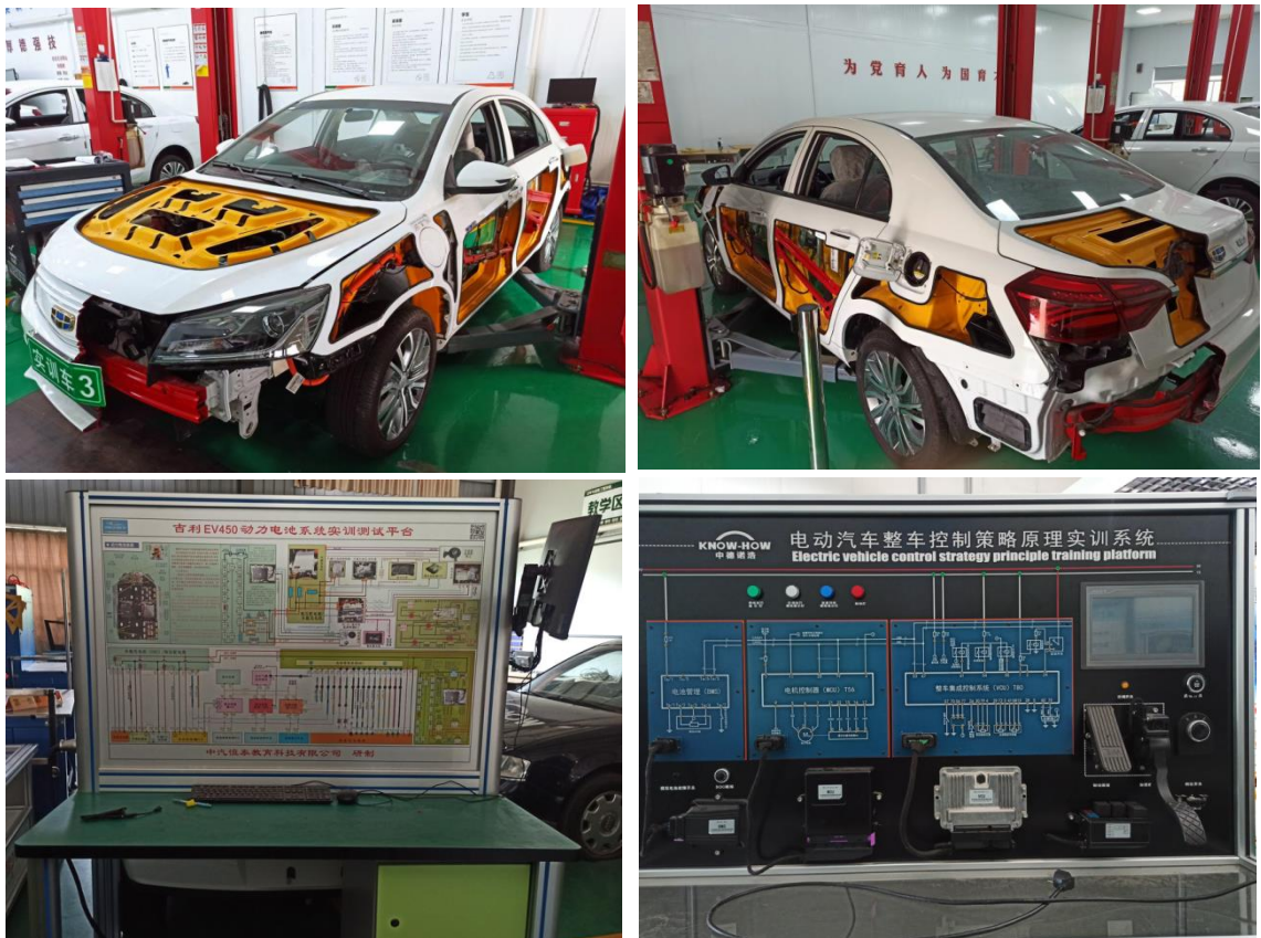
新能源课程教学设备

开设汽车美容与装潢、钣金、汽车保险与理赔、汽车性能检测、二手车鉴定与评估等选修课程，配置了汽车专业的检测维修工具和设备，教学用车有奔驰、宝马、迈腾等各种品牌车辆 30 余辆。