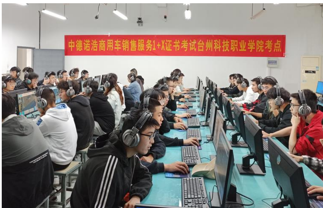
学生在 1+X 证书考试过程中