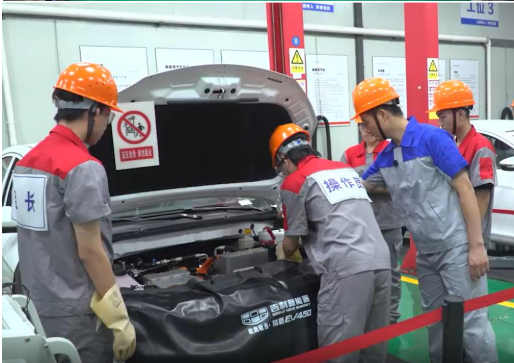
学生在理实一体教室中上课