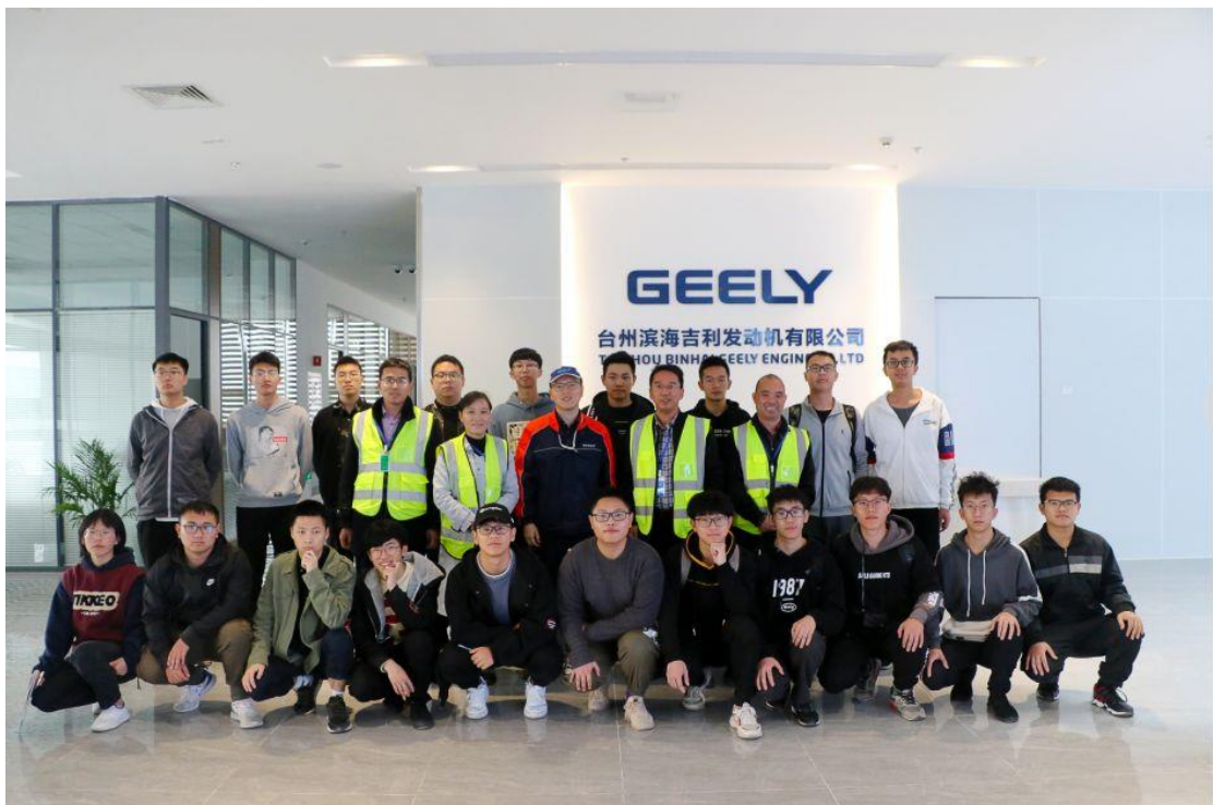
毕业班学生赴吉利发动机公司顶岗实习

学生基本上能够根据汽车机械以及电控的构造和工作原理，能够对常见的车辆故障进行诊断和维修，通过此次的专业实习，将在学校学习的专业知识，充分的运用到企业实践中，保证与企业需求零距离。通过此次社会实践确认适合自己的职业及岗位、为向职场过渡做准备，增强就业竞争优势。